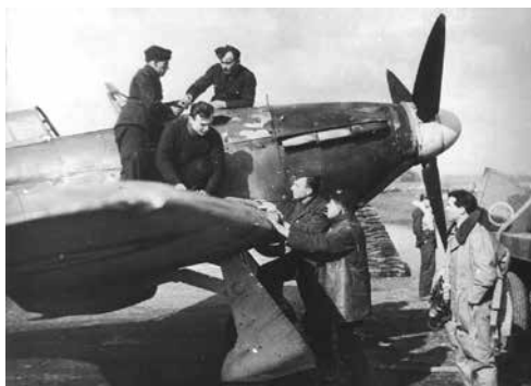
Josef Bryks na fotce u britské stíhačky Hurricane Mk.II.

v zajetí. Téhož roku bylo jméno první ženy, která spáchala sebevraždu, vyryto do pomníku padlým odbojářům ve Velkém Meziříčí. Bryks nechal její jméno z pomníku odstranit, to však popudilo jejího komunistického otce.